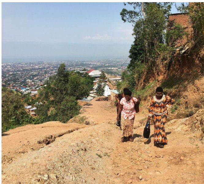
Den der var stejl - min telefon sagde 64 etager fra bilen til kirken!

Hvis man vil læse mere, kan man gå ind på www.baptistkvinder.dk under Rwanda og Burundi og læse rapporter fra besøgene.