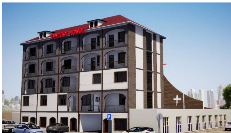
Visualisering af den nye bygning og den eksisterende kirke