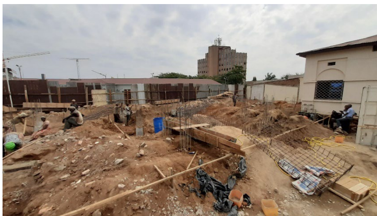
Byggepladsen den 28/6

Det er UEBB's målsætning, at bygningen er færdig inden missionens 100-års jubilæum i 2028 og med den entusiasme og beslutsomhed, der udvises, er vi sikre på, at det lykkes. UEBB håber selvfølgelig også, at de internationale samarbejdspartnere i f.eks. Danmark vil bidrage til projektet.