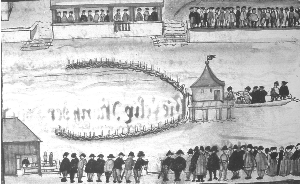
Døbere får deres 'tredje dåb' da de druknes i Zürich

dømmet o.l.) udgjorde en enhed. I Zürich og omegn blev der døbt ca. 800, hvoraf kun få levede efter forfølgelserne i 1528.