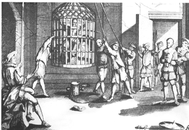
Münster-døberne puttes i bure i 1535

De, der i dag besøger bymidten i Münster, bliver stadig mindet om de forfærdelige begivenheder, der fandt sted for knap 500 år siden, idet de tre jernbure stadig hænger i spiret på Skt. Lamberti kirke. Bortset fra nogle få korte perioder har burene hængt der siden 1535.