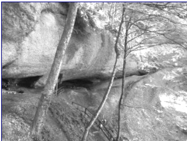
Den såkaldte 'Døberhule' (Täuferhöhle) ved Bäretswil øst for Zürich, hvor døbere gemte sig for myndighederne.

Baggrunden for denne skæbne skal findes i lovgivningen på reformationstiden. En løsning på 'problemet' i Mitteleuropa fandt kejser Karl V frem til, da han 4. januar 1528 indførte påbud om, at alle der gendøbtes skulle henrettes.