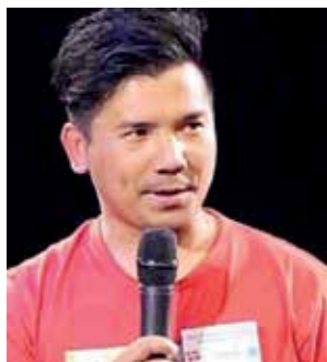
Af Sambuh Langle Studerende på 3K

Min barndom var svær, for jeg boede på en buddhistisk munkeskole. Ved min hjemkomst var min far blevet arresteret i Malaysia for at demonstrere for Burma.