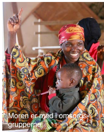
Moren er med i omsorgsgrupperne