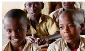
BØRNELIV OMSORG, MAD OG SKOLE I BURUNDI