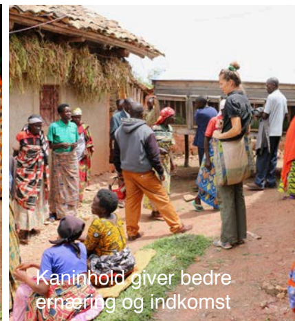
Kaninhold giver bedre ernæring og indkomst