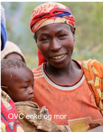
OVC enke og mor