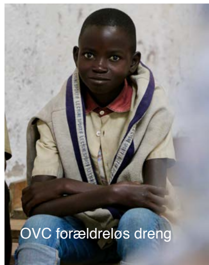
OVC forældreløs dreng