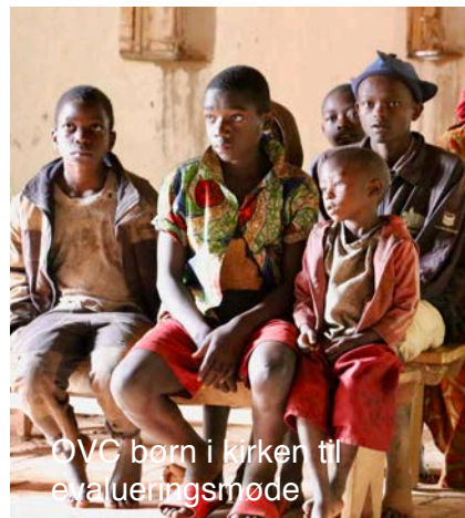
OVC børn i kirken til evalueringsmøde