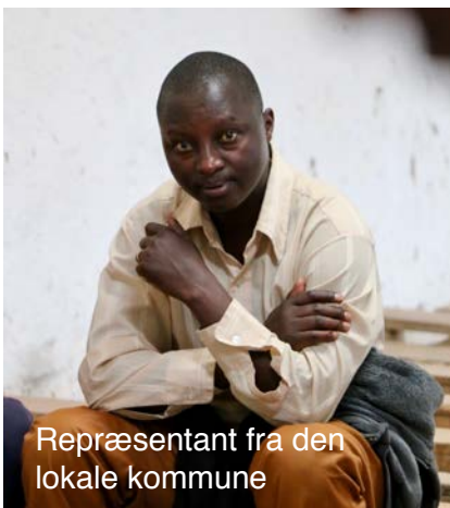
Repræsentant fra den lokale kommune