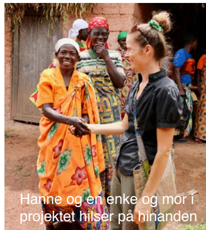
Hanne og en enke og mor i projektet hilser på hinanden