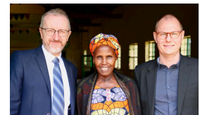
TIMOTHY LEDELSE AF KIRKE OG SAMFUND