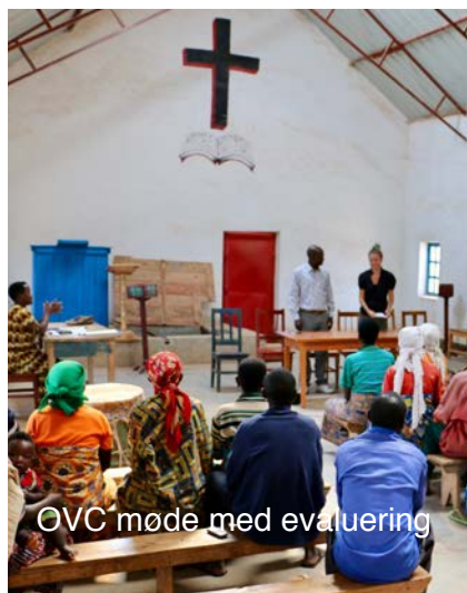
OVC møde med evaluering