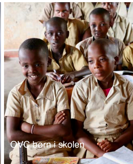
OVC børn i skolen